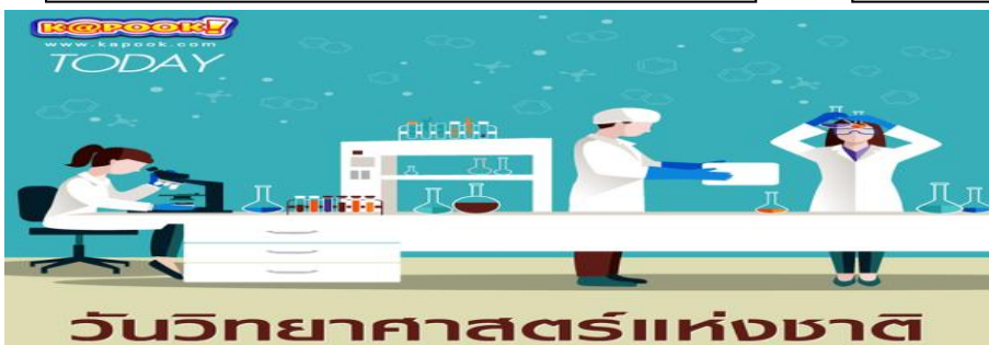
วัน 18 สิงหาคม 2559 “วันวิทยาศาสตร์แห่งชาติ”